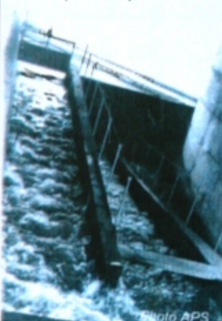
Première échelle construite en rive droite

Finalement, à la requête de l'APS, une action contre la ville de Vichy fut déposée devant le tribunal administratif de Clermont-Ferrand le 28 janvier 1982. L'affaire se termina par un match nul et les deux parties renvoyées dos à dos pour avoir porté leur différend devant une juridiction « incompétente pour en connaître ».