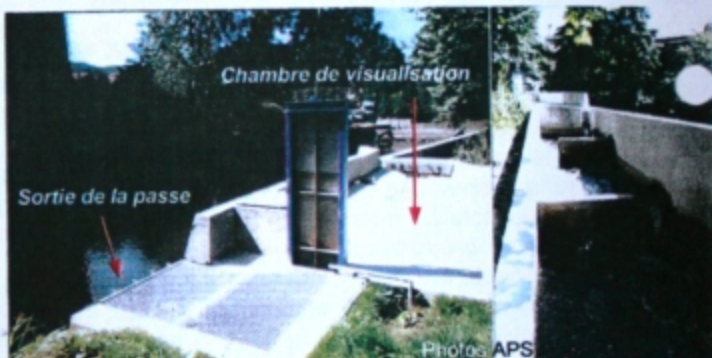
Sortie de la passe