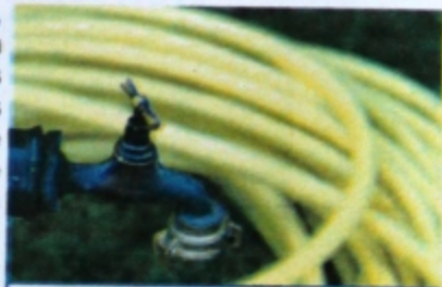
Gestion de l'eau délicate !

Résultat la gestion de l'eau a été plus que délicate et pour une fois, reconnaissons le, les barrages bien que néfaste à l'environnement aquacole, ont limité les dégâts et maintenu en partie les étiages. Pourtant les agriculteurs ont critiqué vertement la gestion de l'eau, et notamment celle de la retenue de Naussac, et n'hésitent pas à demander d'autres retenues... !- Des fois que l'on permette à ces messieurs de gaspiller un peu plus le précieux liquide, pour mieux assassiner la nature !