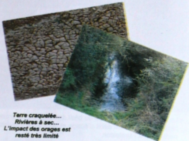
Terre craquelée... Rivières à sec... L'impact des orages est resté très limité

Les sept premiers mois de l'année ont connu un niveau de précipitation particulièrement faible. Ce bilan est inquiétant pour l'avenir du cheptel saumon, mais aussi plus généralement sur la faune et la flore aquatique.