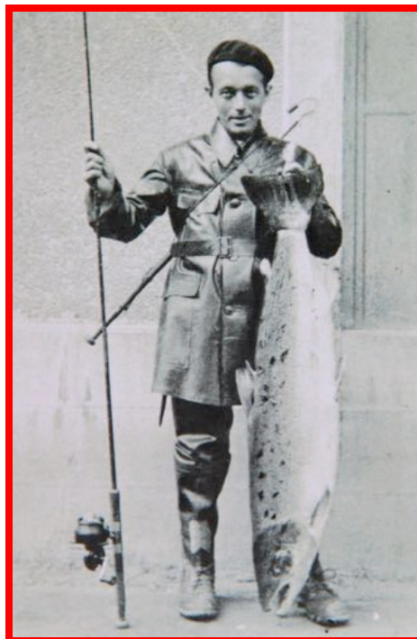
Saumon de 17 kg

A cinq ou six mètres de la rive il refuse obstinément de venir plus près. La luminosité commence à décroître. Bientôt nous serons en infraction. Il faut conclure coûte que coûte. Mon père, gaffe en main va le chercher à pleines cuissardes et le ramène au sec, non sans peine. Quelle bête ! 1 mètre 23 ! 17 kilogrammes ! Qui dit mieux !