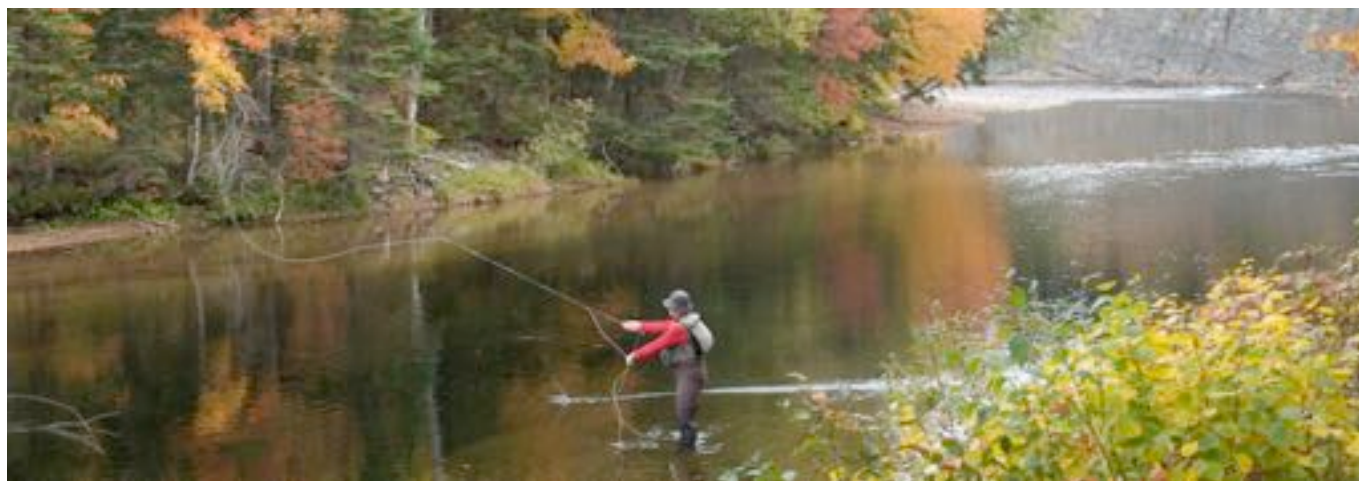
La rivière Magaree

Le total des dépenses attribuées à la pêche au saumon est juste au dessus de 2,5 millions de dollars CND soit 1,76 millions d'Euros. Les résidents représentent 23 %, les visiteurs des autres provinces Canadiennes ou de nationalités autres que Canadienne représentent 67 %, soit les deux tiers des dépenses. Les principales dépenses sont les locations de voitures, les locations de gîtes, les chambres d'hôtel, le matériel de pêche, la nourriture. Un pêcheur de saumon dépense en moyenne 206 dollars CND / jour, soit 145 € / jour (en 2005).